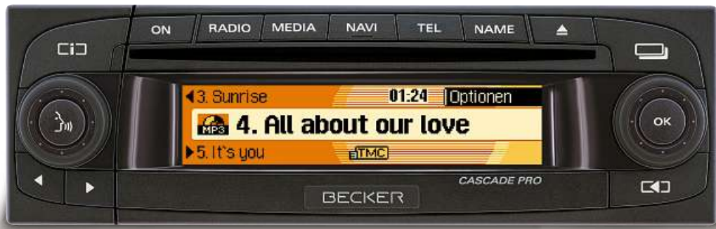
Becker Cascade Pro 7941